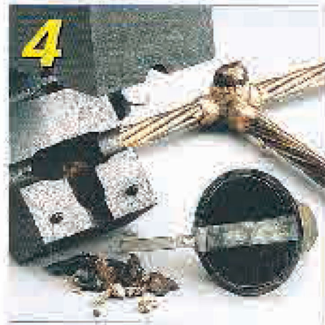
Adım 4: Kaynak soğuduktan sonra pota açılır ve ambalaj şeklindeki cüruf kolayca temizlenir.

CADWELD PLUS elektronik ateşleyicisi, kaynak işlemini tetikler. Standart ateşleyici 1.8 mt.'lik kablo ile gelir. Kablonun ucunda, ambalajdaki ateşleme şeridine takılan özel tasarım, yüksek sıcaklığa dayanıklı başlık bulunmaktadır.