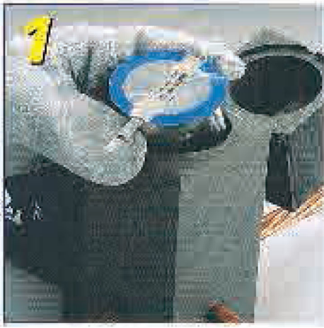
Adım 1: Cadweld Plus ambalajı pota içine yerleştirilir.