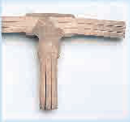
CADWELD kaynak, iletkenin ömrü ile aynıdır.