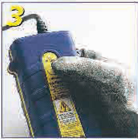
Adım 3: Elektronik ateşleyici düğmesine basılı tutularak ateşleme yapılır.